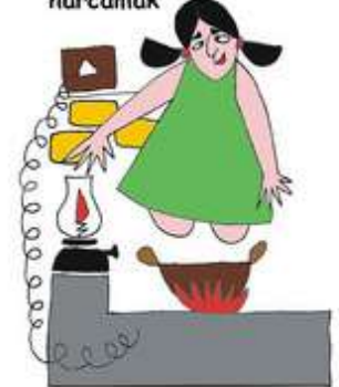
Zarar verecek durumlarda çocuğu denetimsiz bırakmak