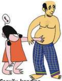
Çocuğu kendine dokunmaya zorlamak