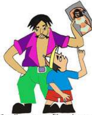
Çocuğu pornografik malzemeye veya davranışlara maruz bırakmak