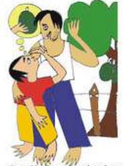
Çocuğu kendi çıkarları için kullanmak