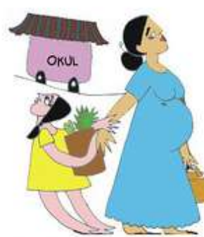
Çocuğun eğitim gereksinimlerini göz ardı etmek