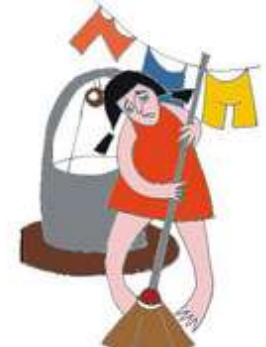
Başka işler yaptırarak çocuğun eğitim ve hobileri için kullanacağı zamanı harcamak