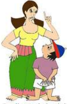
Çocuğu sözel olarak hırpalamak