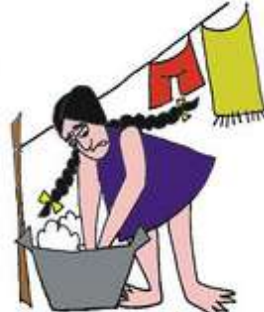
Çocuğu hizmetçi gibi kullanmak