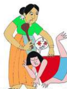
Öfkeyi, gerginliği azaltmak için çocuğu örsellemek, itip kakmak