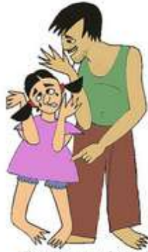
Çocuğu gereksiz yere ağlatmak