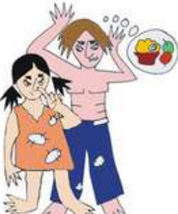
Çocuğa yeterli bakım sağlamamak, ör: Kirli, çıplak, aç bırakmak