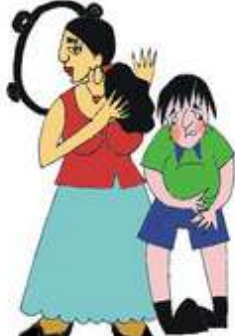
Çocuğun tıbbi gereksinimlerini göz ardı etmek