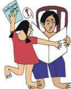
Çocuğun özgüvenini kırmak