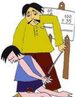
Okulda çocuğa vurmak veya aşağılamak