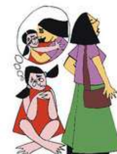
Çocuğun duygusal gereksinimlerini göz ardı etmek