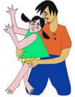
Çocuğun dokunulmasını istemediği yerlerine dokunmak